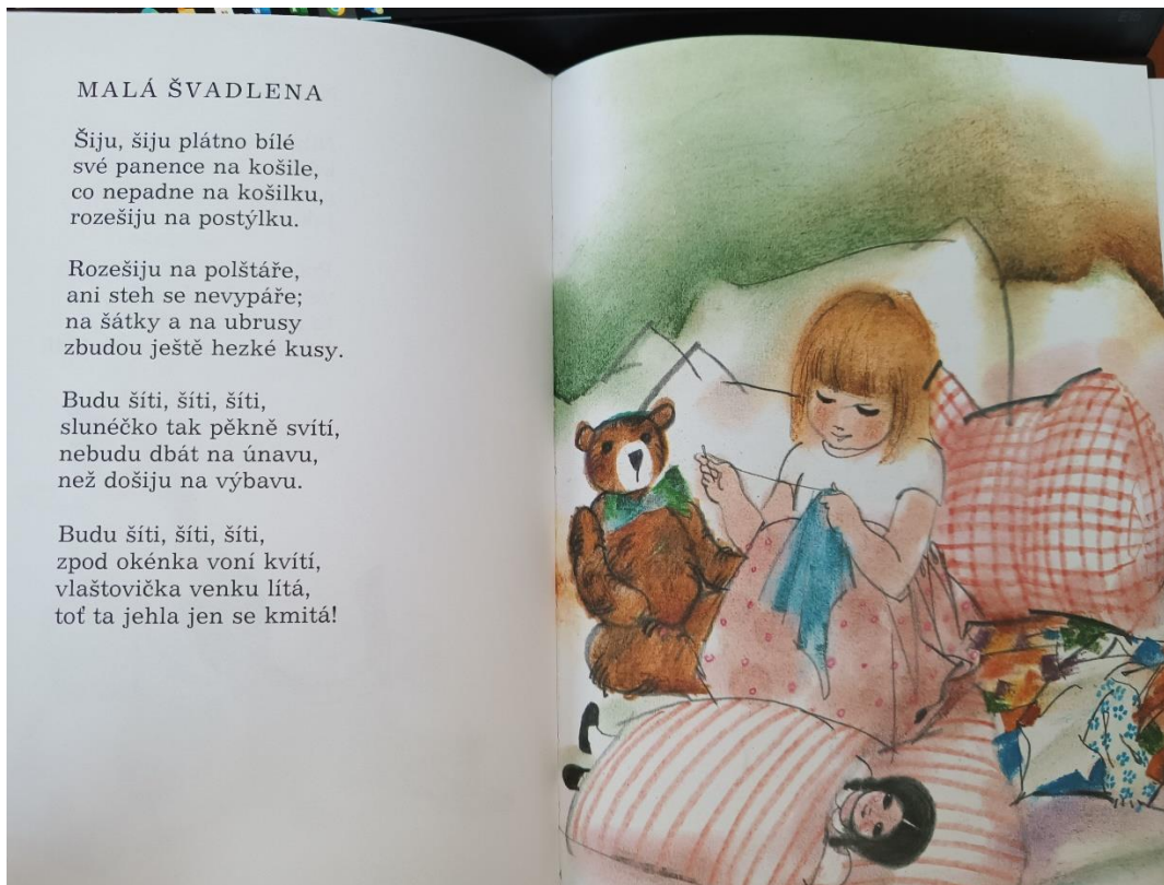
Z knihy J. V. Sládek, Zlaté slunce, bílý den